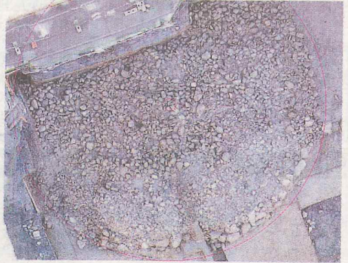
Il tumulo funerario scoperto durante gli scavi archeologici nel cantiere davanti all'Ospedale regionale ad Aosta